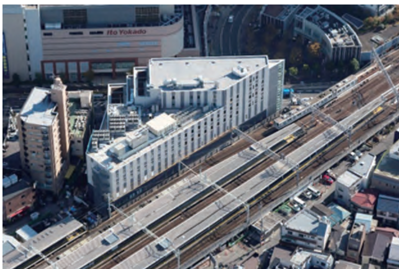
(完成が間近に迫る東京曳舟病院。病院は東武曳舟駅直結です)

大阪地区ではやはり夏、大阪市此花区の旧暁明館病院跡地に関西では二基目となる陽子線治療装置とIMRT装置をそなえた、がん放射線治療施設「大阪陽子線クリニック」を開業いたします。この最新の施設を用いて伯鳳会グループのみならず、関西一円のがん治療に貢献したいと考えています。