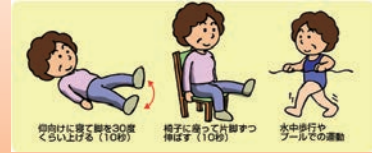
運動療法や減量などの自己管理

しかし、高度な膝の変形のため、薬物療法も無効であれば人工膝関節置換術などの手術を行うこともあります。