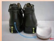
サポーター・足底板