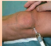
鎮痛剤・湿布・ヒアルロン酸の関節注射