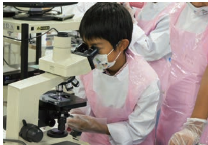
口内の細菌を採取し、染色して観察しました。

来年度も開催する予定ですので、小学4年生から6年生のキッズの皆さん参加をお待ちしています!