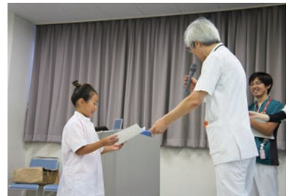
参加者全員に「手洗い名人」の認定証を授与して終了しました。